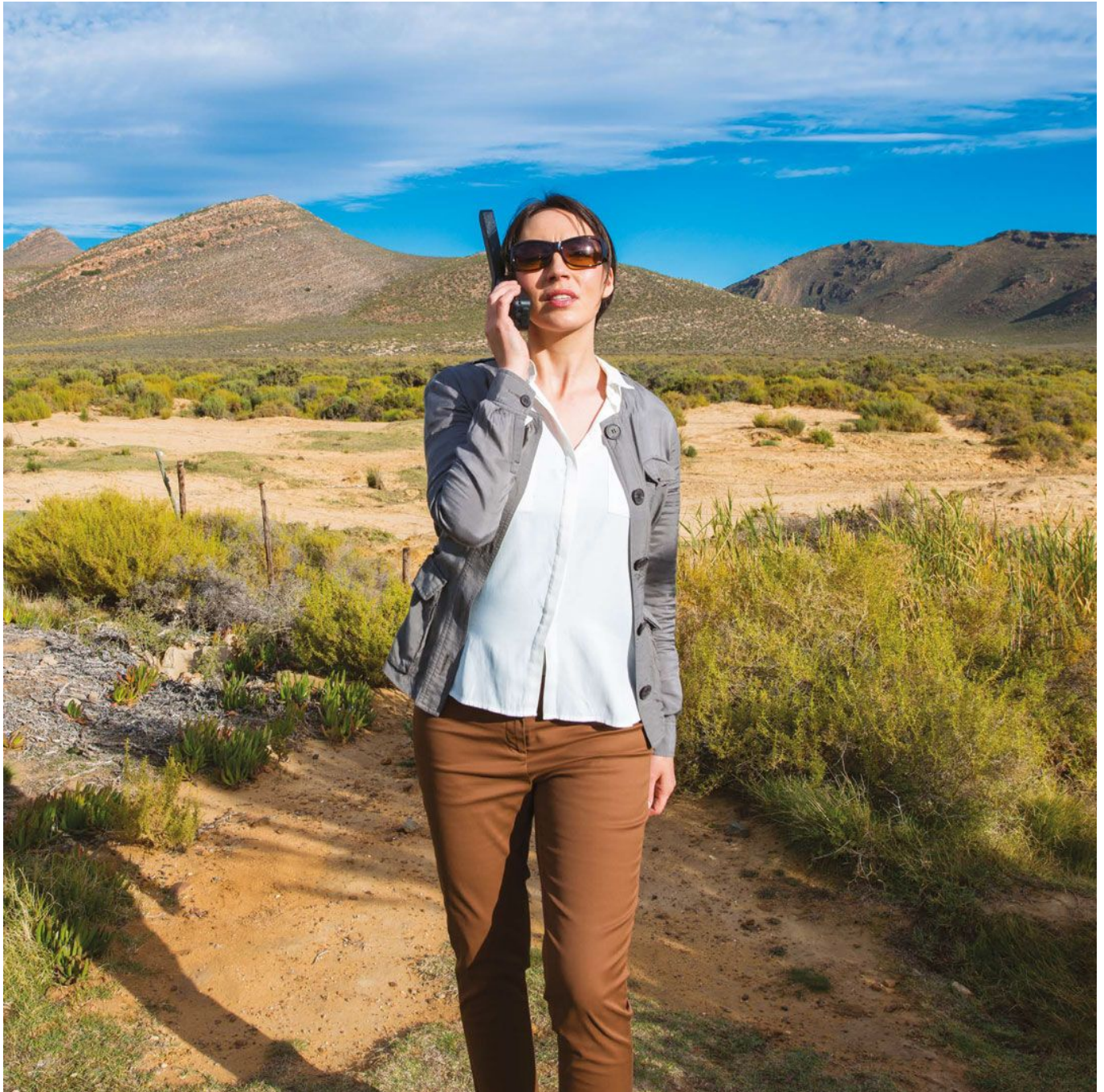
Inmarsat Isatphone Pro 2

communication en zone éloignée. Voici une évaluation approfondie de ce produit, y compris ses avantages, ses inconvénients, ses caractéristiques et ses comparaisons avec d'autres technologies similaires sur le marché.